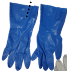
01425291 GUANTO DA LAVORO FORMAT 4250505601721