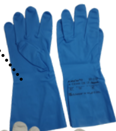
01425376 GUANTO DA LAVORO FORMAT OPTINIT 472 8